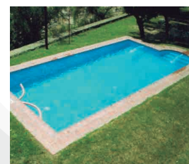
HOTEL PALACE - PISCINA