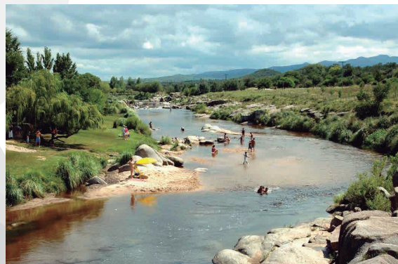
MINA CLAVERO - BALNEARIOS